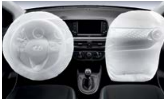
Hệ thống an toàn 2 túi khí