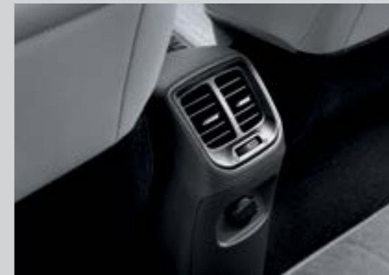
Cửa gió điều hòa hàng ghế thứ 2