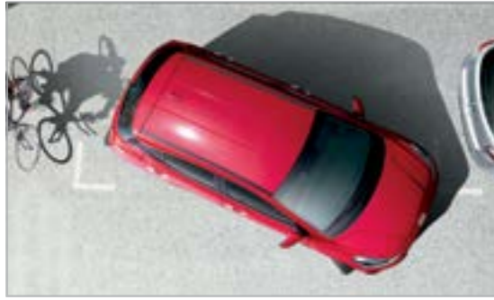
Cảm biến va chạm phía sau