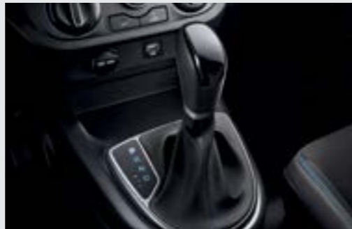
Hộp số tự động 4 cấp