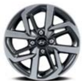
Vành hợp kim 15 inch cao cấp tạo hình trẻ trung