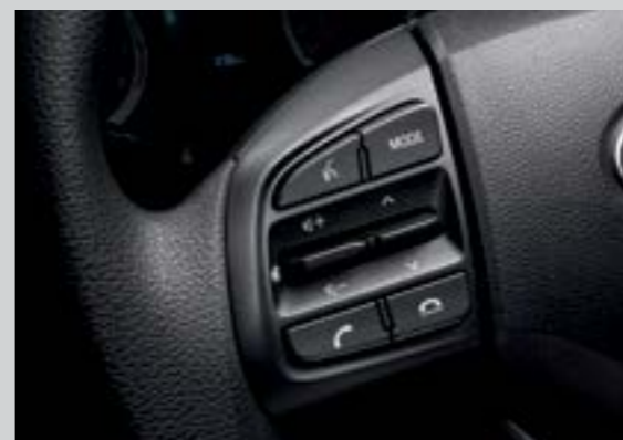
Cụm điều chỉnh media tích hợp nhận diện giọng nói