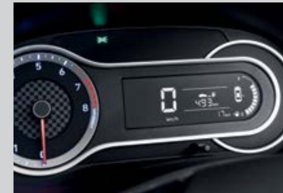
Màn hình thông tin thiết kế thể thao