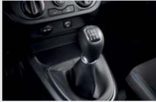
Hộp số sàn 5 cấp