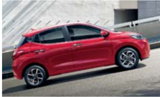
Hệ thống hỗ trợ khởi hành ngang dốc tích hợp với cân bằng điện tử