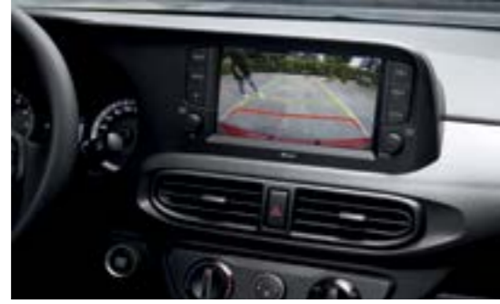
Camera lùi hỗ trợ đỗ xe