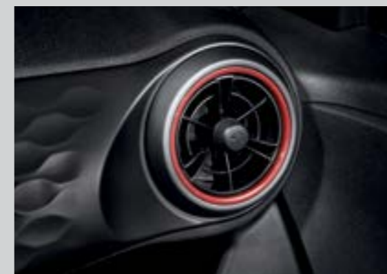
Cửa gió điều hòa dạng tua bin với 2 tông màu trẻ trung