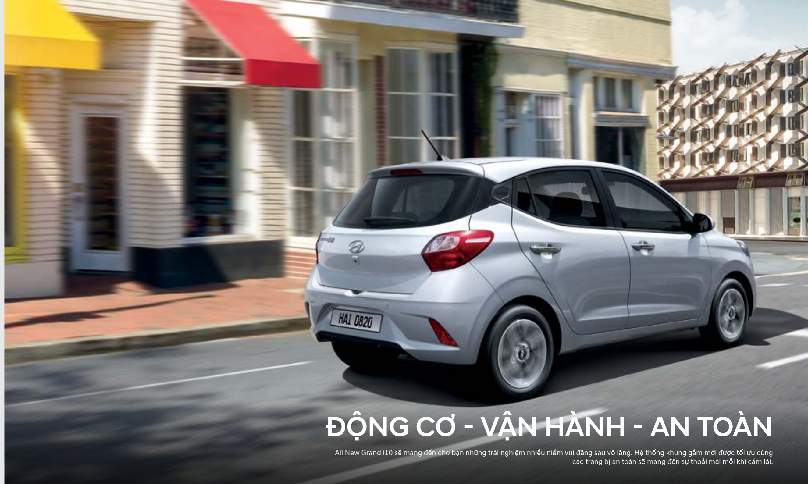
Được tối ưu để tạo nên sự cân bằng giữa niềm vui lái xe và khả năng tiết kiệm nhiên liệu