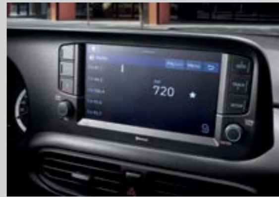
Màn hình giải trí 8 inch

Khoang nội thất của All new Grand i10 là tất cả những gì bạn cần. Đó là sự rộng rãi của không gian kết hợp cùng sự tỉ mỉ, tinh tế trên các chi tiết cùng các tiện ích vượt tầm phân khúc.