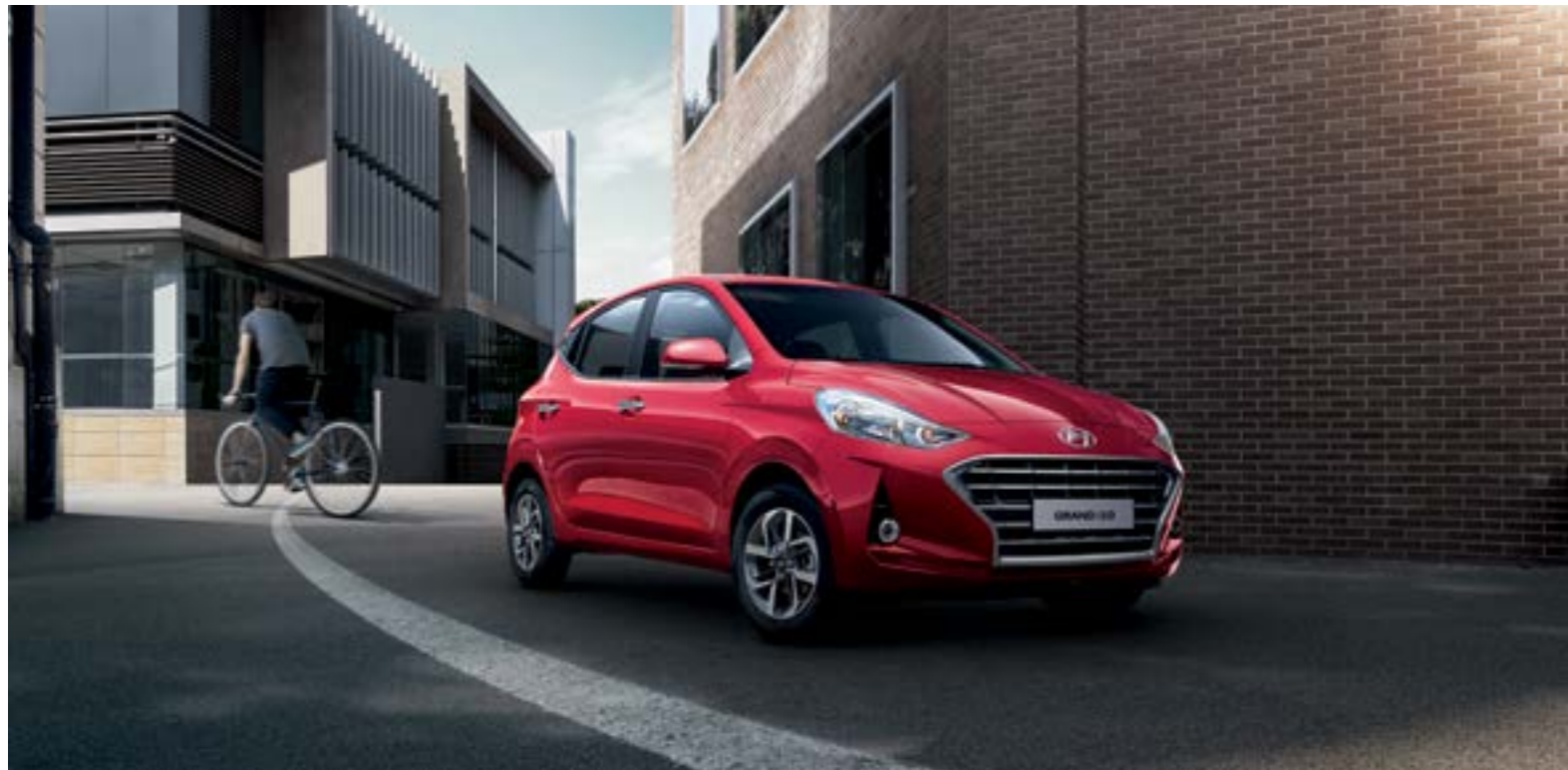
Tiên phong trong thiết kế với các đường nét thể thao, trẻ trung cùng mặt lưới tản nhiệt Crom tạo ra khí chất người dẫn đầu.