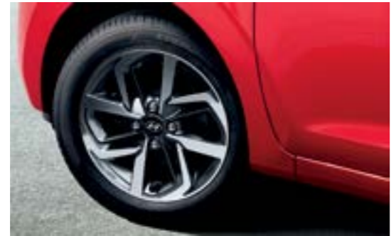
Hệ thống cảm biến áp suất lốp