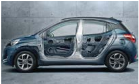
Hệ thống khung mới cứng vững hơn với thép cường độ cao AHSS