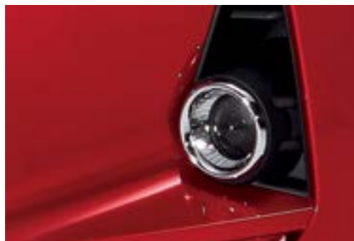
Đèn sương mù tích hợp trên cản trước thể thao