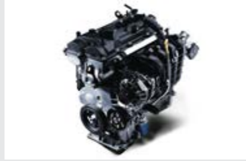
Động cơ Kappa 1.2L mang đến khả năng vận hành êm ái, ổn định cùng với khả năng tiết kiệm nhiên liệu nhưng vẫn đáp ứng được nhu cầu vận hành của khách hàng.